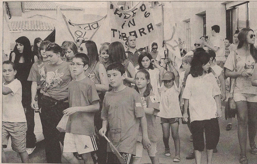
Peñistas participan en un desfile festivo.