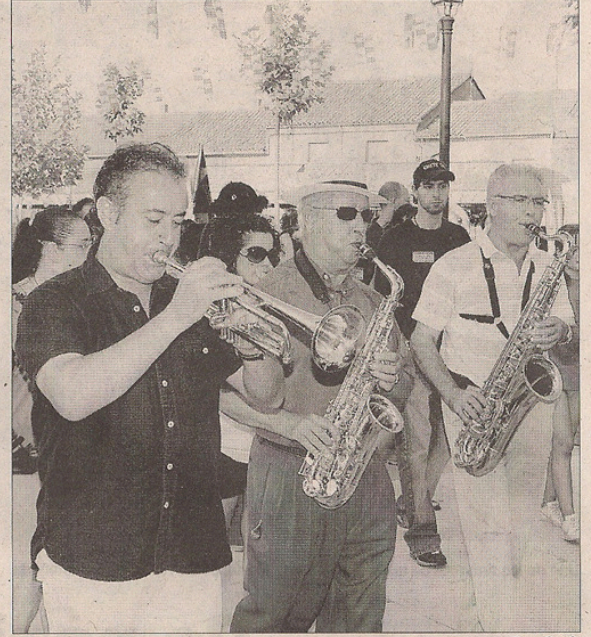
Músicos durante un pasacalles.